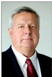
Alain Perret, préfet, directeur de la Sécurité civile

Les 250 000 sapeurs-pompiers de France sont les premiers acteurs de la sécurité civile. Au delà des 11 000 interventions de secours qu'ils effectuent quotidiennement au profit de nos concitoyens, ils contribuent directement à la solidarité nationale : Xynthia, les inondations du Var ou encore les secours et l'aide à la reconstruction apportés à Haïti ont, cette année encore, illustré l'efficace d'un dispositif capable à la fois d'assurer une couverture des risques locaux et d'appréhender les crises nationales ou internationales.