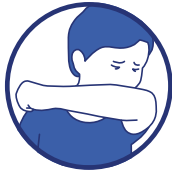
Toussez ou éternuez dans votre coude ou dans un mouchoir