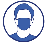
Portez un masque chirurgical ou en tissu de catégorie 1 quand la distance de deux mètres ne peut pas être respectée