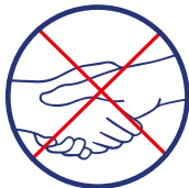
Saluez sans serrer la main et arrêtez les embrassades