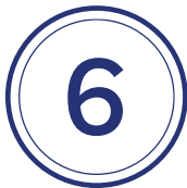
Limiter au maximum ses contacts sociaux (6 maximum)