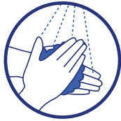
Lavez-vous régulièrement les mains ou utilisez une solution hydro-alcoolique