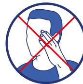
Évitez de vous toucher le visage