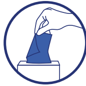
Mouchez-vous dans un mouchoir à usage unique puis jetez-le