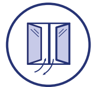
Aérer les pièces le plus souvent possible, au minimum quelques minutes toutes les heures