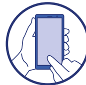
Utiliser les outils numériques (TousAntiCovid)